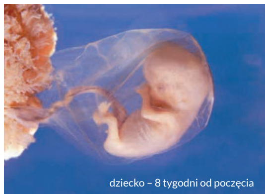
dziecko – 8 tygodni od poczęcia