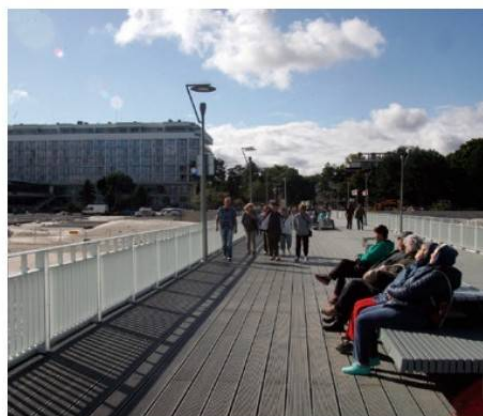
W 2015 r. w Kołobrzegu z leczenia uzdrowiskowego skorzystało aż 117 tys. kuracjuszy.