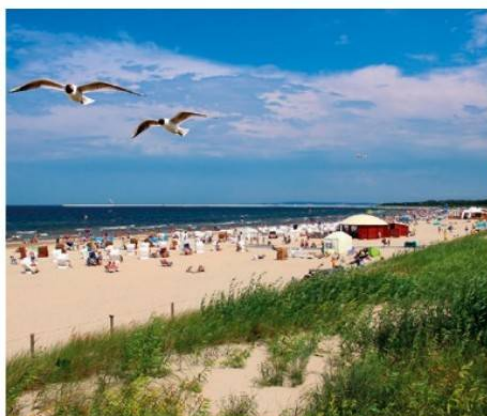
Wypoczynkowi nad Bałtykiem sprzyjają słoneczna pogoda i piaszczyste, szerokie plaże.

Te piaszczyste formy odcinają płytkie wody Zatoki Puckiej i Zalewu Wiślanego od otwartego morza.