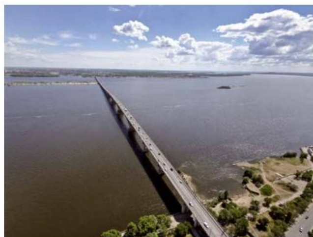
▲ Wołga ma długość ponad 3500 km i jest najdłuższą rzeką Europy. W wielu miejscach jej szerokość wynosi kilka kilometrów.

Ob z Irtyszem, Jenisej z Angarą i Leną, a także Wołga, która jest najdłuższą rzeką Europy.