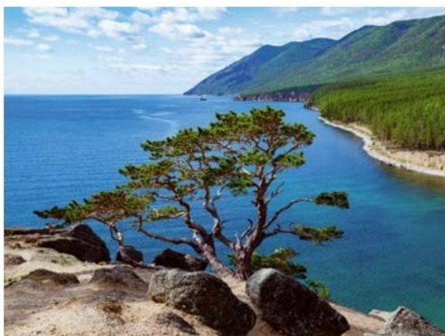
▲ Leżący koło Irkucka Bajkał jest najgłębszym jeziorem na Ziemi. Jego największa głębokość wynosi 1620 m.

Na terytorium Rosji płynie wiele rzek. Do najdłuższych należą znajdujące się w części azjatyckiej :