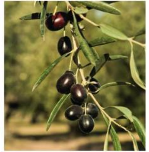
▲ Z owoców drzewa oliwnego tłoczy się oliwę.

Ludność strefy śródziemnomorskiej poza turystyką zajmuje się też rolnictwem .