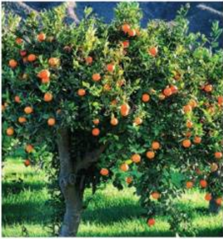
▲ Pomarańcze należą do owoców cytrusowych.