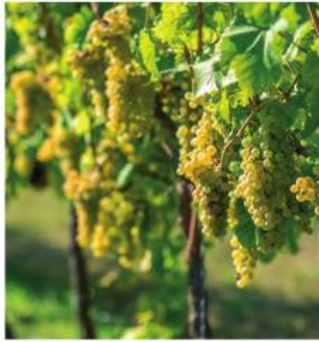
▲ Owoce winorośli służą na przykład do produkcji wina.