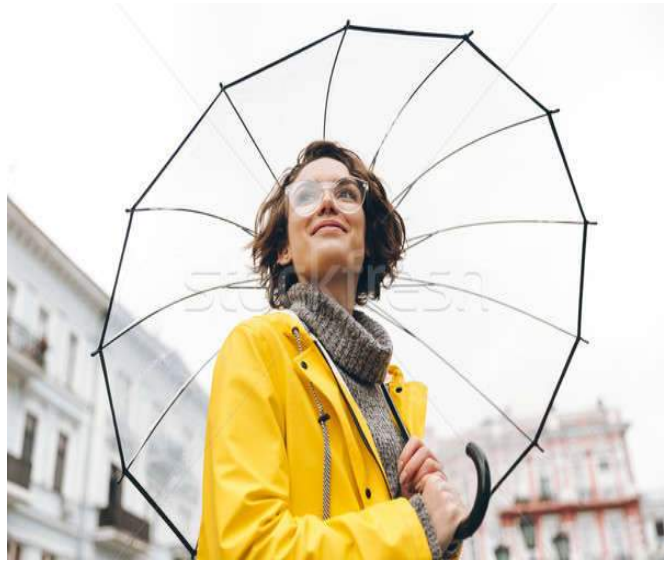
Ochronna funkcja ubioru i chroni w pracy