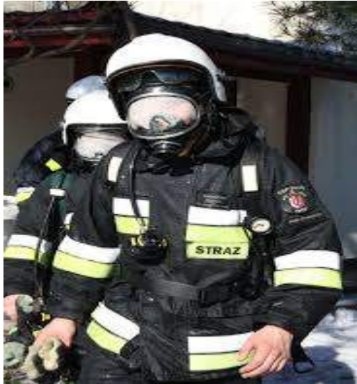
Ubiór strażaka- określa zawód