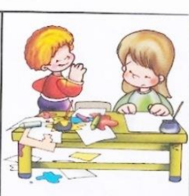
Rysunek nr 6