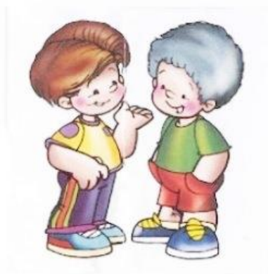
Rysunek nr 1