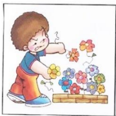
Rysunek nr 4