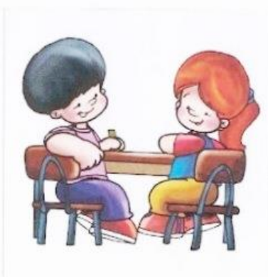
Rysunek nr 2