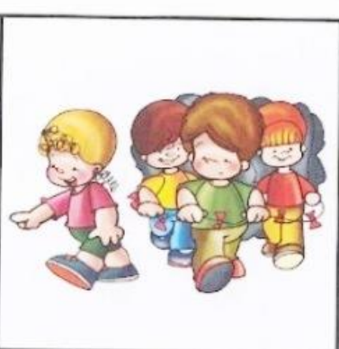
Rysunek nr 5