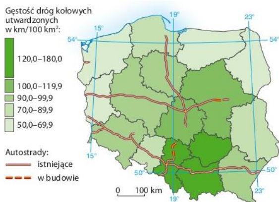
Gęstość dróg kołowych utwardzonych oraz autostrady w Polsce w 2015 r.

Kolej ma mniejsze znaczenie w przewozie towarów, transportuje się głównie węgiel kamienny z Górnego Śląska do portów w Szczecinie, Gdańsku i Gdyni.