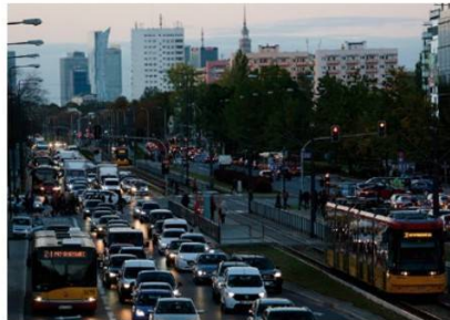
Warszawa to jedno z najbardziej zakorkowanych miast Europy. Jej mieszkańcy spędzają w korkach samochodowych nawet kilkadziesiąt minut dziennie.

Coraz więcej ludzi przenosząc się na obrzeża miasta powoduje wzrost zaludnienia w strefach podmiejskich. Zmiany obejmują również użytkowanie i zagospodarowanie terenu . Strefy podmiejskie