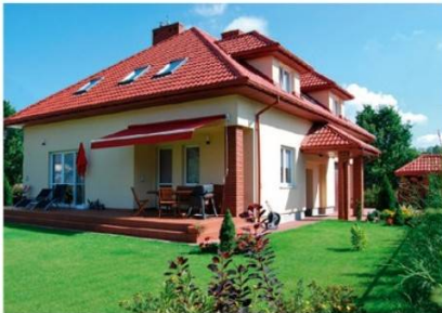
Chęć posiadania własnego domu z ogródkiem to jeden z głównych powodów, dla których wiele osób przeprowadza się z dużych miast do stref podmiejskich.