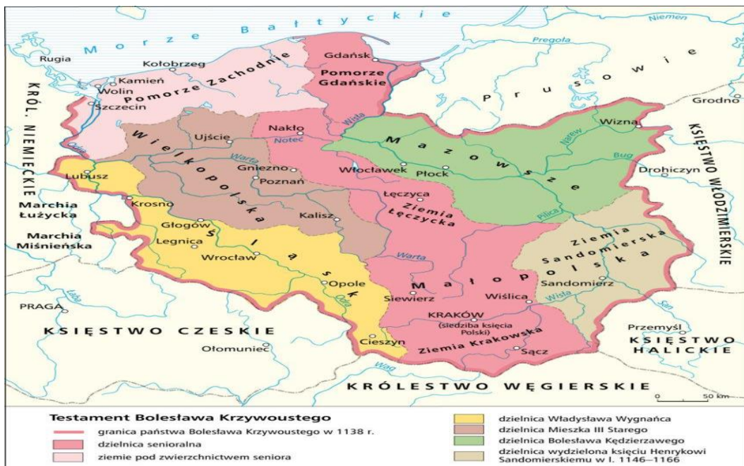
MAPA POLSKI PO 1138 ROKU