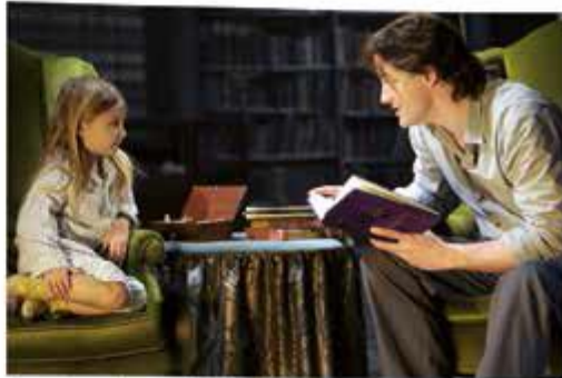
Na podstawie powieści Cornellii Funke Atramentowe serce w 2009 roku powstał film o tym samym tytule.

– Wyszli stamtąd – powiedział. – Po prostu nagle pojawili się w drzwiach, tak jakby przyszedli z dworu. Kiedy się do nas odwrócili, rozległ się szelest, jak gdyby ktoś rozwijał kartkę papieru. Stało się to, zaledwie wymówiłem ich imiona: Basta, Smolipaluch, Capricorn. Basta trzymał Smolipalucha