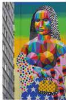
Mural, który powstał w jednej z dzielnic Paryża.