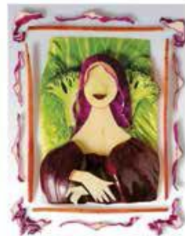
Kompozycja z warzyw inspirowana dziełem Leonarda da Vinci.