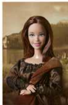
Lalka upodobniona do postaci z obrazu.