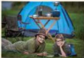
Wymyśliliśmy nową zabawę.