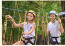
Trochę się przestraszyłam.