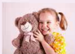
Sukienka w [?] (groch)