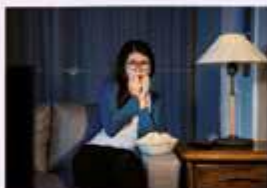
[?] film. (strach)