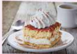
Ciastko z [?] kremem. (puch)