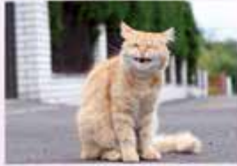
[?] żart. (śmiejch)