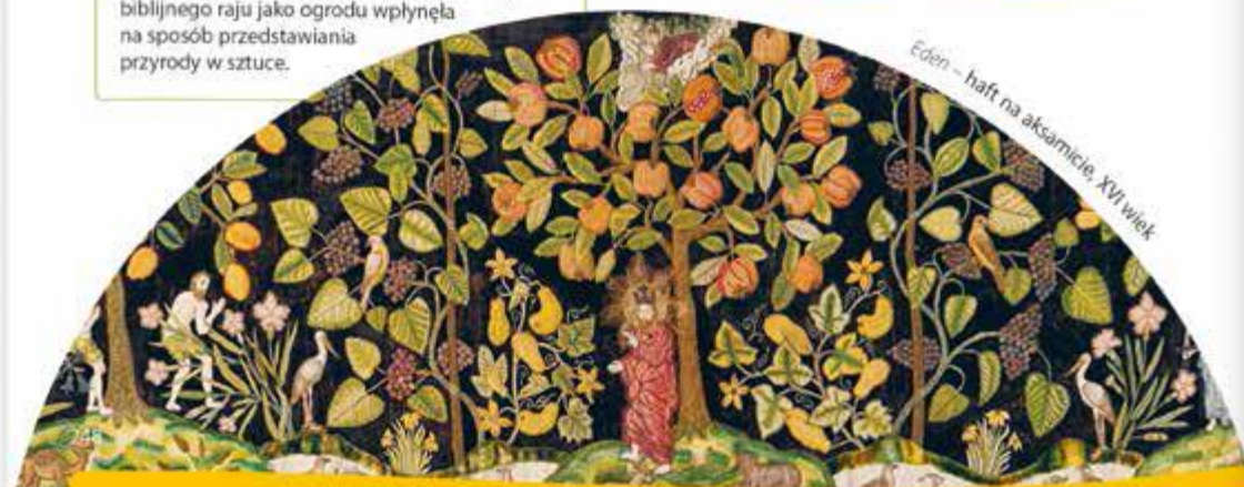
Eden – haft na aksamicie, XVI wiek

Liście, kwiaty i owoce to główne elementy haftu ukazującego rajski ogród – idealne miejsce, w którym Bóg umieścił człowieka, a następnie z powodu grzechu go stamtąd wygnał. Wizja biblijnego raju jako ogrodu wpłynęła na sposób przedstawiania przyrody w sztuce.