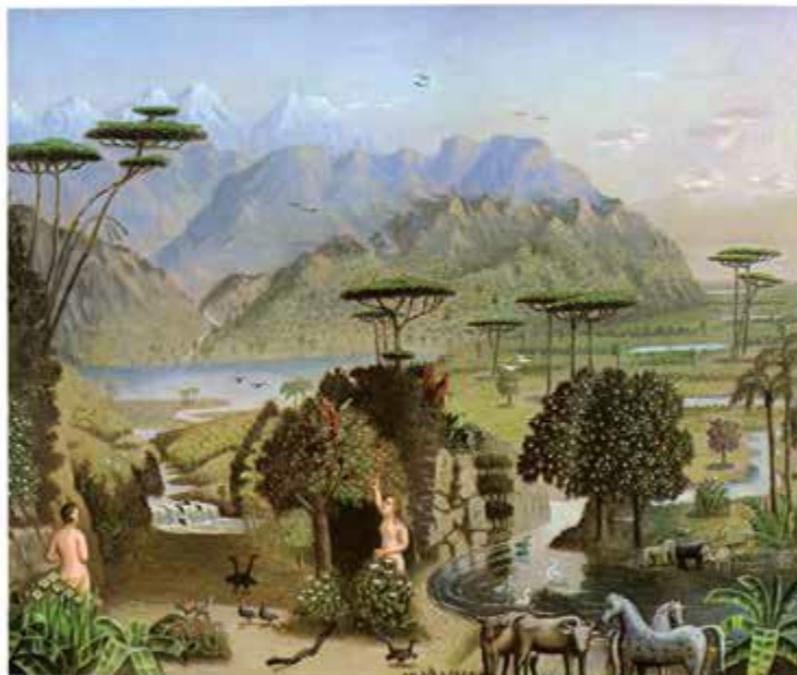
Erastus Salisbury Field (czytaj: erastus szelberci fild), Ogród Eden , około 1865 roku