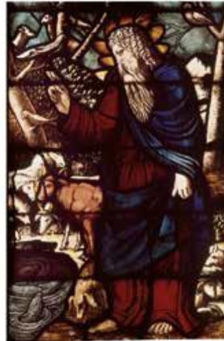
Witraż znajdujący się w jednym z włoskich muzeów przedstawia stworzenie zwierząt przez Boga.