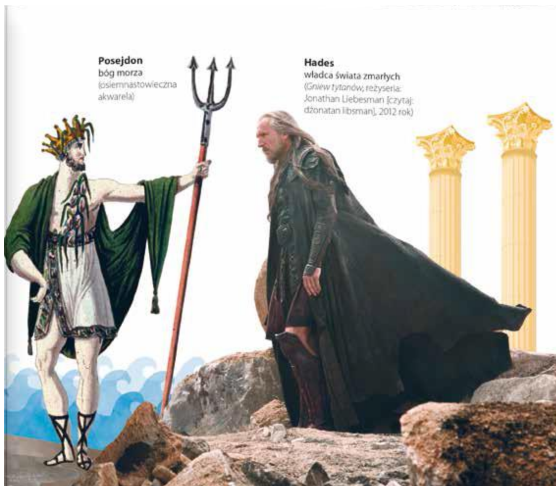
Posejdon bóg morza (osiemnaściołwieczna akwarela)