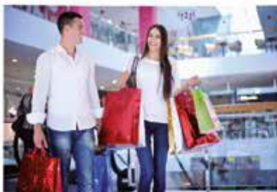
Jedna z osób niosących torby z zakupami funduje posiłek bezdomnej osobie.