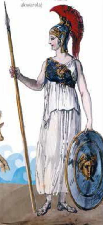
Atena bogini mądrości, patronka wojny sprawiedliwej (osiemnastowieczna akwarela)