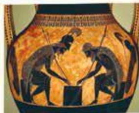
Amfora z około 530 roku p.n.e. przedstawiająca wojowników Achillesa i Ajaksa podczas gry w kości jest przykładem greckiego malarstwa czarnofigurowego.