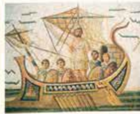
Na rzymskiej mozaice z II wieku naszej ery ukazano króla Itaki Odyseusza oraz jego towarzyszy powracających z wyprawy wojennej.