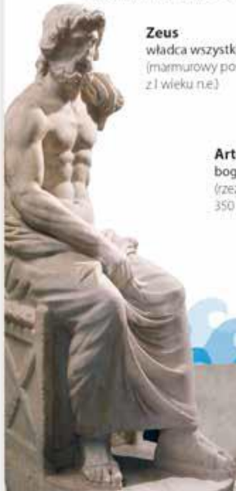
Zeus władca wszystkich bogów (marmurowy posąg z I wieku n.e.)

Postacie z mitologii greckiej na stałe zadomowiły się w naszej kulturze. Spotykamy je w literaturze, malarstwie, rzeźbie, filmach, a nawet... w grach komputerowych. Zobaczcie, w jaki sposób twórcy z różnych epok nawiązywali do tematyki mitologicznej.