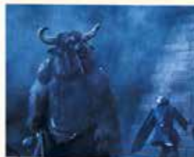
W filmie Opowieści z Narnii. Książę Kaspian z 2008 roku pojawił się minotaur Asterius – pół byk, pół człowiek.