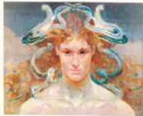
Polski malarz Jacek Malczewski w 1900 roku namalował obraz przedstawiający Meduzę , czyli kobietę z wężami zamiast włosów.