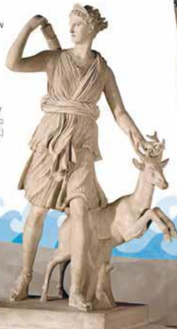
Artemida bogini łowów (rzeźba z około 350 roku p.n.e.)