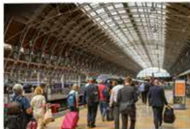
Bohater pomaga podróżnemu odnaleźć bagaż zgubiony na dworcu.