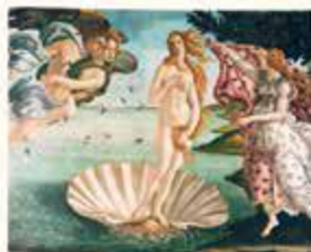
Jednym z najbardziej znanych dzieł poświęconych bogini miłości są Narodziny Wenus Sandra Botticellego [czytaj: boticzellego] z około 1485 roku.