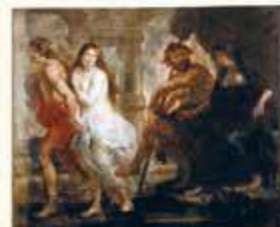
Śpiewak Orfeusz i jego ukochana Eurydyka to główni bohaterowie obrazu namalowanego w 1636 roku przez Petera Paula [czytaj: pitera pola] Rubensa.