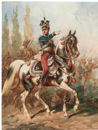
Juliusz Kossak, General Jan Henryk Dąbrowski na czele Legionów, 1882 rok

Przejdziem Wisłę, przejdziem Wartę, będziem Polakami. Dał nam przykład Bonaparte 3 , jak zwyciężać mamy.