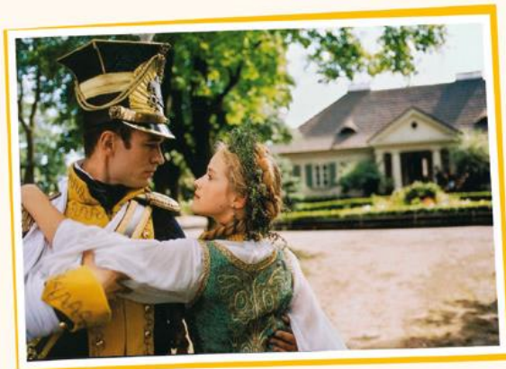
Pan Tadeusz , reżyseria Andrzej Wajda, 1999 rok

Na podstawie utworu Adama Mickiewicza powstał film Pan Tadeusz w reżyserii Andrzeja Wajdy – ekranizacja pełna dynamicznych, burzliwych wydarzeń, a zarazem wyróżniająca się humorem, urokiem i poetycką magią. Opisy przyrody znane z utworu pisarza zostały oddane za pomocą obrazów filmowych.