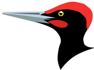
kujący w drewnie