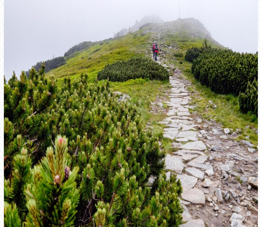
BABIOGÓRSKI PARK NARODOWY