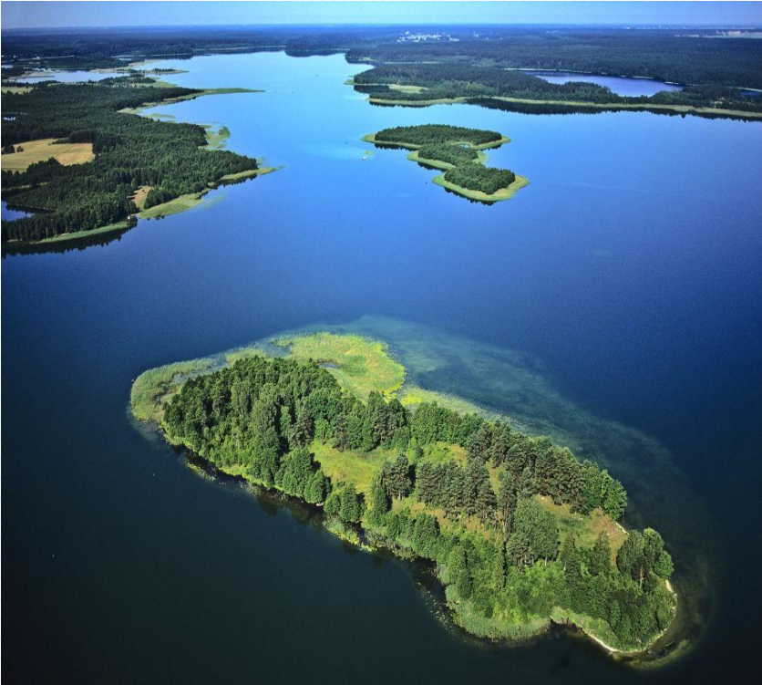
WIGIERSKI PARK NARODOWY