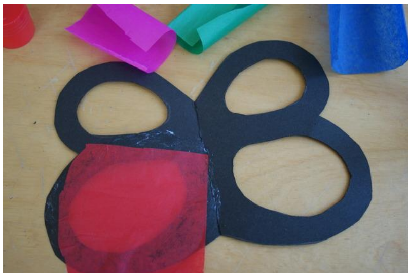
Tak wygląda gotowy witraż

3. Do otworów przykładamy bibułę, odrysowujemy ich kształt ołówkiem i wycinamy około 5 mm więcej niż wskazują linie. Nakładamy klej na odpowiednie krawędzie i przyklejamy wycięty fragment. Powtarzamy czynność do momentu kiedy wszystkie otwory będą zaklejone.